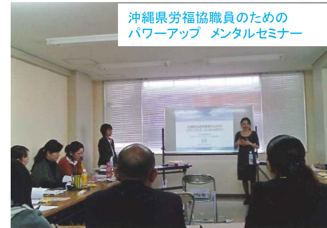
沖縄県労福協職員のための パワーアップ メンタルセミナー