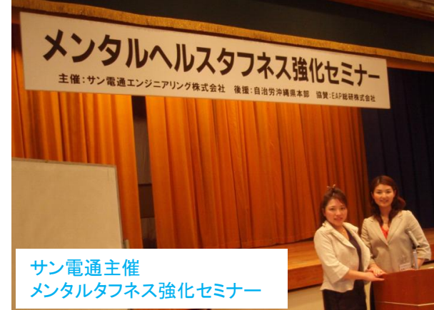
サン電通主催 メンタルタフネス強化セミナー