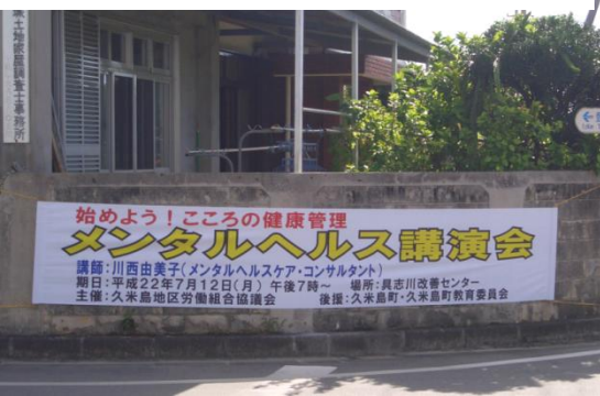
久米島地区労働組合協議会 メンタルヘルス対策セミナー