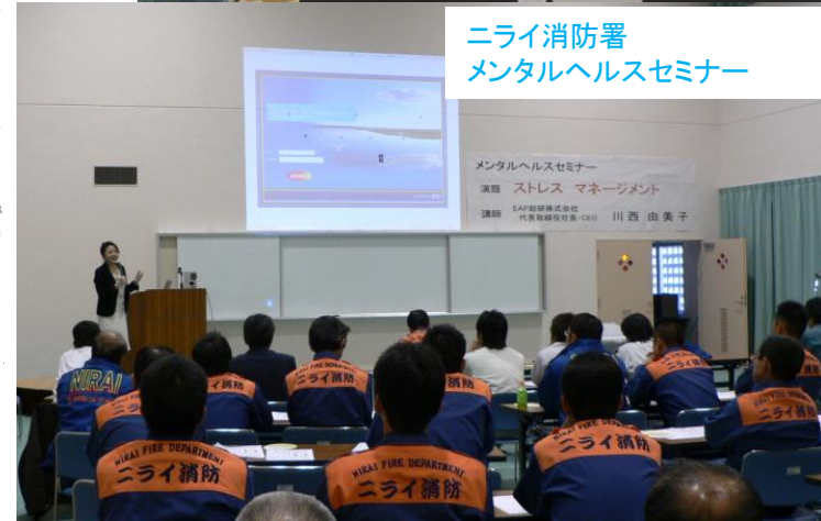
ニライ消防署 メンタルヘルスセミナー