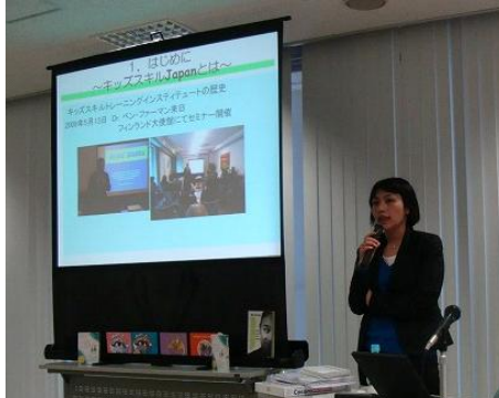
沖縄での キッズスキルアンバサダー研修