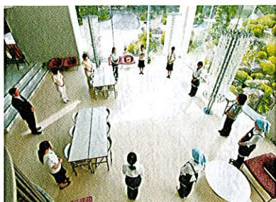
小さな「気付き」を積み重ねた「8カ条」を全員で唱和。お客をもてなす心をつにす。

エ、売店などがひとつになったもの。今では年間10万人の見学者が訪れる。「健康の森」で働く女性たちの仕事は見学者をもてなすこと。彼女たちは毎日、朝礼を行い、「もてなし」について真剣に考えている。その成果が「健康の森8カ条」である。